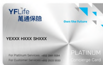
萬通保險Platinum寰宇貴賓卡 (樣本)

*小貼士：登入萬通保險「YFLink」服務及資訊應用程式，並按主頁右上角之按鈕，便可以展示以上卡面