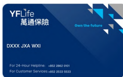
萬通保險電子客戶卡 (樣本)